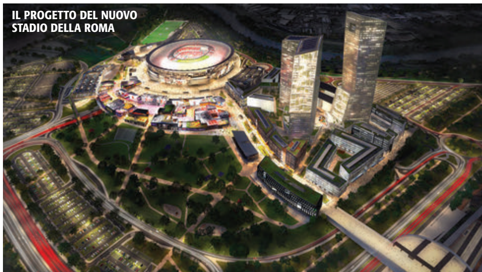
IL PROGETTO DEL NUOVO STADIO DELLA ROMA

Fincapitol Srl - Agenzia in Attività Finanziaria della Prestitalia SpA Società del gruppo UBI Banca per potenziamento della rete commerciale (finanziamenti - prestiti - cessione del quinto)