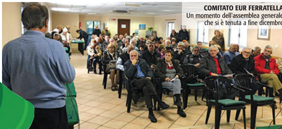
COMITATO EUR FERRATELLA Un momento dell'assemblea generale che si è tenuta a fine dicembre