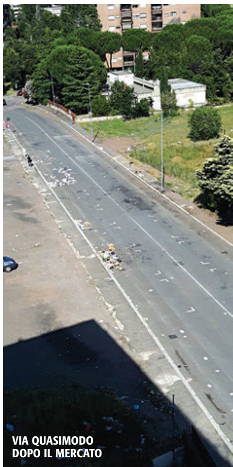
VIA QUASIMODO DOPO IL MERCATO