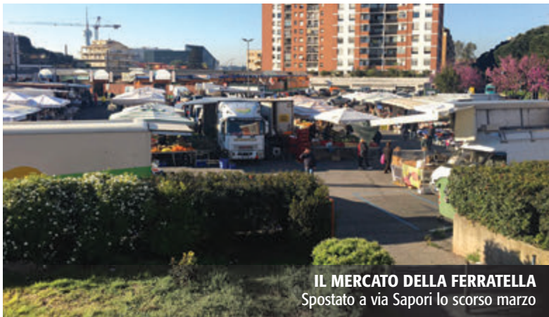
IL MERCATO DELLA FERRATELLA Spostato a via Saponi lo scorso marzo

"Insomma - concludono dal Comitato Eur Ferratella - mentre in tantissimi quartieri di Roma prendono sempre più piede queste nuove realtà di commercio che avvicinano produttori e cittadini, garantendo a questi ultimi una eccellente qualità di prodotti e prezzi concorrenziali, nel nostro quartiere sembra impossibile realizzare anche una cosa così semplice e con benefici per tutti, oltretutto fino a ieri richiesta a gran voce. Siamo delusi da questa forte resistenza ad ogni forma di cambiamento, ci piacerebbe avere un quartiere con una vocazione innovativa e con la voglia di cambiare lo status di quartiere dormitorio e senza una consolidata aggregazione dei suoi abitanti che ci ha connotato fin qui. Ma per realizzare un cambiamento servirebbe l'aiuto, oltretutto dei cittadini, di tutte le parti sociali presenti nel quartiere, a cominciare da quelle che si sono dimostrate così ingessate in questa occasione. Noi comunque non ci arrendiamo e proveremo a realizzare qualcosa che possa portare beneficio al nostro territorio".